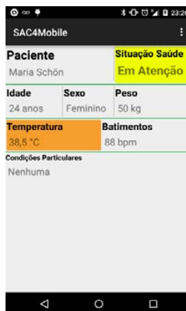
Figura 3. Protótipo SAC4Mobile

SAC e os Serviços SAC, estes dois hospedados na nuvem, Amazon EC2. O monitoramento dos sinais vitais é realizado através de um dispositivo vestível que monitora a temperatura corporal do paciente – desenvolvido utilizando Arduino Lilypad e sensores de temperatura – e de uma smartband que monitora a frequência cardíaca – FitBit Charge HR. Nos protótipos desenvolvidos, o modelo SAC objetivou o menor desconforto ao utilizador da solução. A Figura 3, apresenta o protótipo SAC4Mobile.